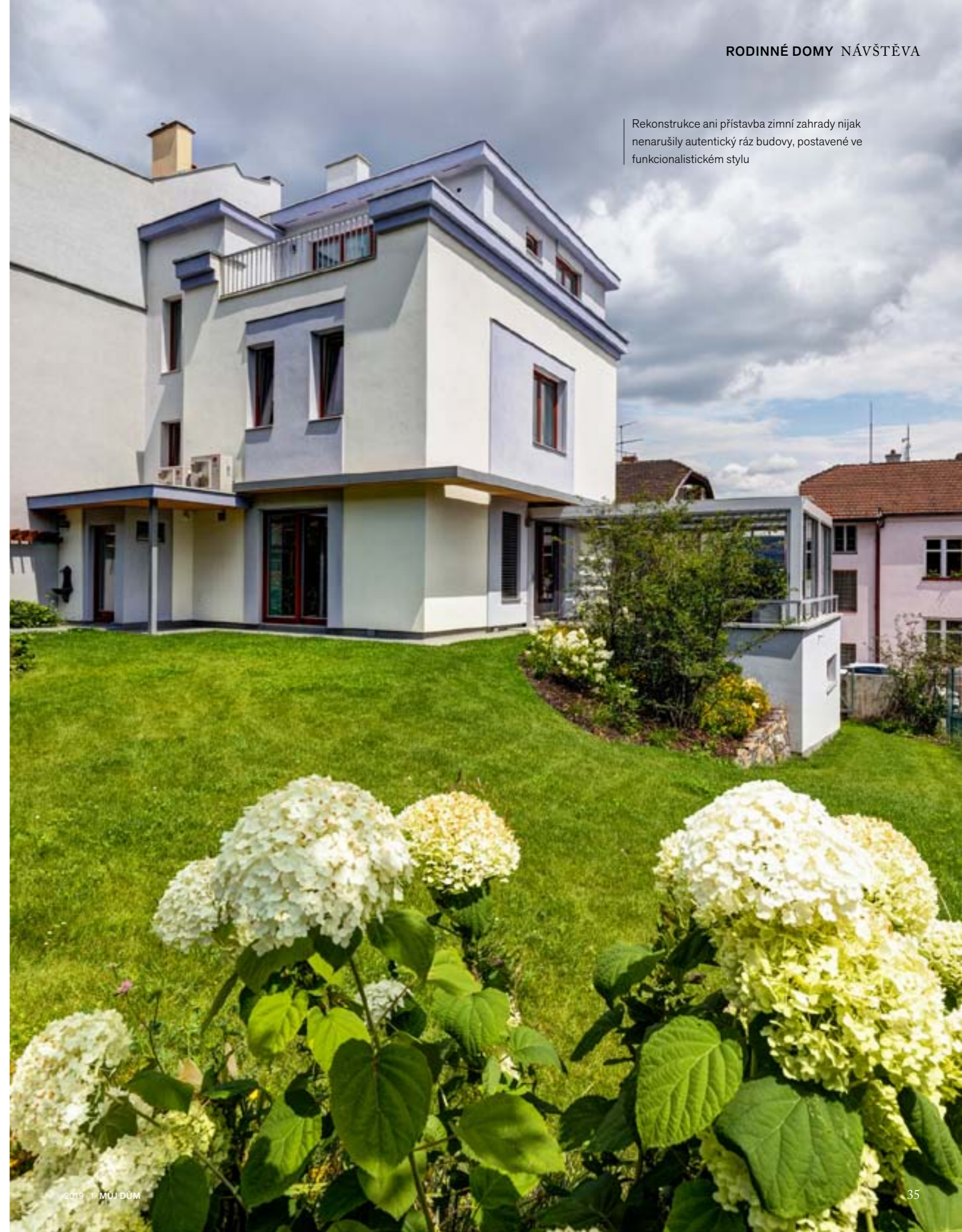
Rekonstrukce ani přístavba zimní zahrady nijak nenarušily autentický ráz budovy, postavené ve funkcionalistickém stylu

Kontakt: Ing. arch. David Machač ArchFactory s.r.o., www.archfactory.eu d.machac@archfactory.eu