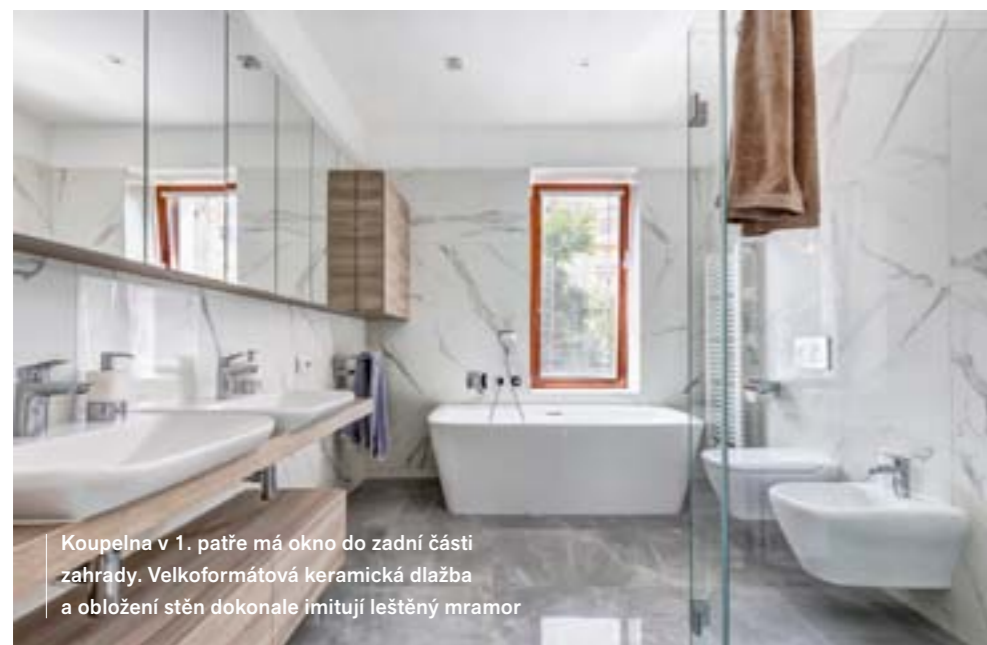
Koupelna v 1. patře má okno do zadní části zahrady. Velkoformátová keramická dlažba a obložení stěn dokonale imitují leštěný mramor